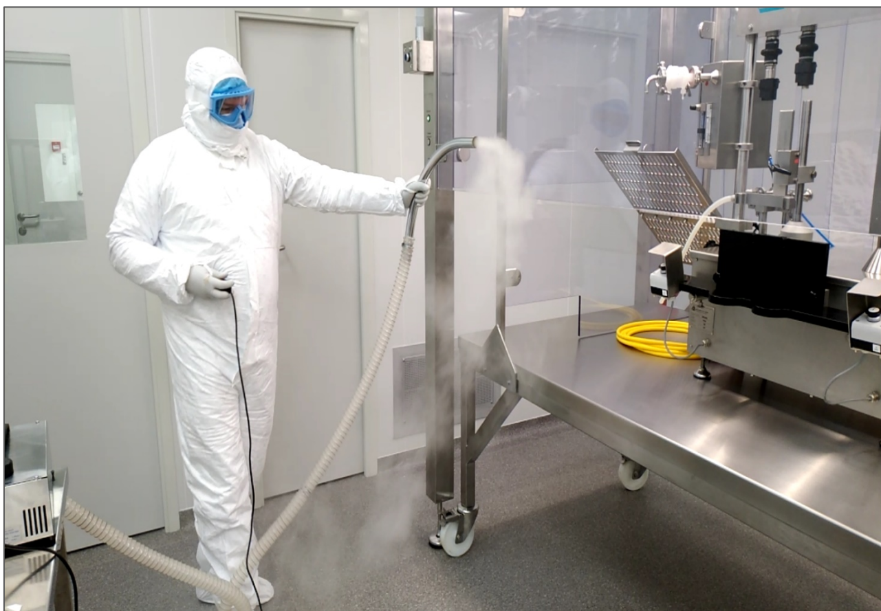
Визуализация воздушного потока с помощью генератора тумана KitAseptica® FOG GEN.

В емкость (1) наливается рабочая жидкость, которая подается насосом (2) в нагреватель (3), где она испаряется. Далее, получившиеся пары смешиваются с потоком воздуха, нагнетаемого вентилятором (4). На выход образуется плотный туман с температурой окружающей среды.