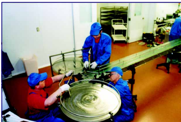
Регулировка накопительных столов

ся прибор визуального контроля в поляризованном свете. Механические включения на темном фоне светофильтров подсвечиваются, как светлячки — отсюда название прибора, и легко обнаруживаются просмотрщиком готовой продукции. Линия заблокирована с наклейкой этикеток. Таким образом, хорошие бутылки сразу поступают на наклейку и далее на упаковку, забракованные бутылки собираются на отдельном накопительном столе, откуда поступают на переработку. Производительность линии 3600 бутылок в час.