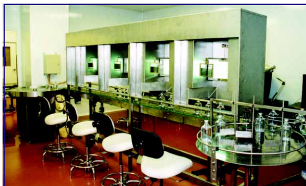
Конвейерная линия «Светлячок-3600» готова к работе

Первым заданием, которое выполнила бригада монтажников-наладчиков, было монтаж и наладка конвейерной линии для контроля инфузионных растворов на механические включения «Светлячок — 3600», разработанной и изготовленной в ООО «Асептика». На линии установлены кабины, в каждой из которых имеет-