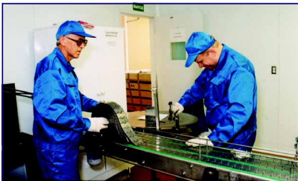
Сборка конвейерной линии

«Асептика» было создано подразделение, выполняющее функции монтажа, наладки, гарантийного и послегарантийного обслуживания.