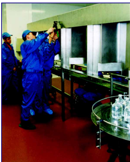
Установка просмотровых кабин

При выборе оборудования для заказчика критериями являются технические характеристики, стоимость, надежность и сервис, который предлагает изготовитель. Под сервисом следует понимать возможность выполнить монтажные и наладочные работы на объекте заказчика, провести обучение персонала, гарантийное и послегарантийное обслуживание. При прочих равных